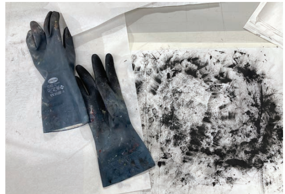
Lehrveranstaltung Grafik, 2022