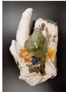
Maispielplatz, 2020 © Wolfgang Schreibeimayr