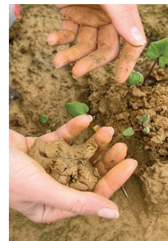
Lehrveranstaltung Erde – Vertiefung Kunstpraxis, 2022

The programme qualifies graduates for teaching art at lower and upper secondary schools. Moreover, it creates professional opportunities in fields such as extracurricular youth work, adult education, cultural work, media relations, museum education, independent artistic activities etc.