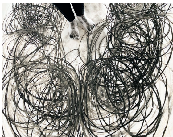
Künstlerische Grundlagen – Zeichnung, 2022 © Jutta Strohmaier