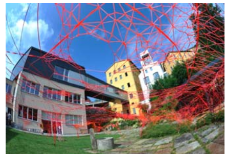
Blick auf das Textile Zentrum Haslach