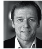
Helmut Dietrich Architekt, Bregenz, Wien