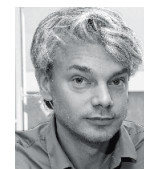
Yves Schihin Architekt, Zürich, CH