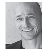
Frank Ludin Architekt, Innsbruck