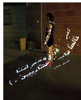
Altahara, Twana Kushmau, Ausstellung „Clean Cube“, Ausstellungsansicht, kulturtankstelle, 2018

Graduates of this branch of study can explore an increasing number of artistic-scientific professional fields. Completion of the programme allows them to be active, for instance, in curating, exhibition design, writing or art criticism. Moreover, they are qualified to work in all art-related areas of the cultural sector.