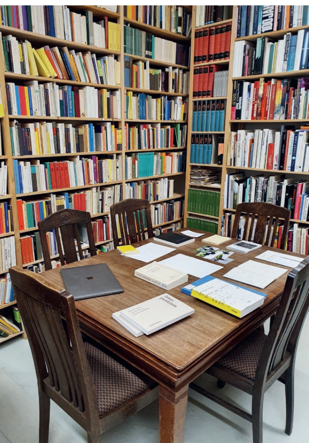
Tischszene, 2020 © Anne von der Heiden

Open up (inter)spaces, explore transitions, test reversals, investigate and try out linkages, move along the borderlines of art and science.