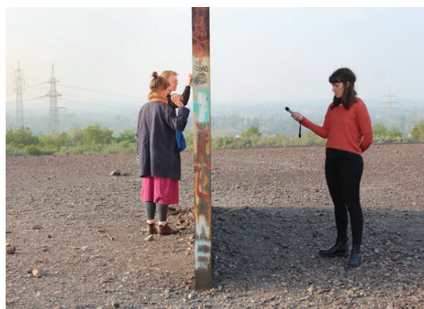
Traurige Tropen - Bunte Türen, Exkursion ins Ruhgebiet und Ausstellungsprojekt, 2019