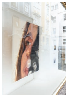
Quarantäne, Crazy Wall Ausstellungsansicht Galerie WHA, 2020