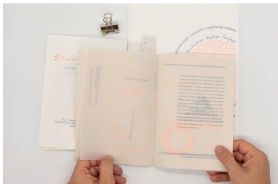
zusammen|schreiben, Hrsg. von Anne von der Heiden u. Sarah Rindler, 2022