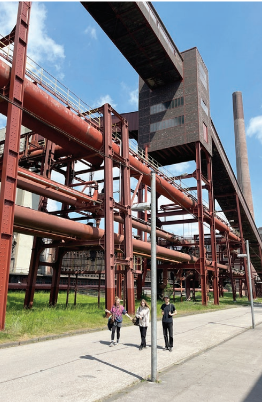
Exkursion Frankfurt/Bonn/ Köln/Düsseldorf/Eszen, 2022 Zeche Zollverein, Essen

Conceptual and discursive exploration of the medium of photography. Cross-media work – photography in dialogue with film/video, painting, installative, performative or textual approaches.