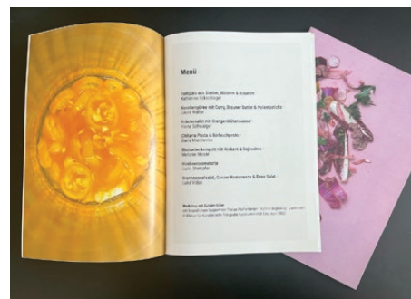
Workshop Gülsüm Güler, 2022 Magazin

The aim of the study programme in Artistic Photography is to adopt an independent artistic position through the teaching of artistic techniques and theory. The focus is on the development of a critical view of one's own work as well as a conscious and conceptual handling of the media possibilities, which enables a self-image as a freelance artist, but also keeps open the possibility of establishing oneself in other art-related fields.