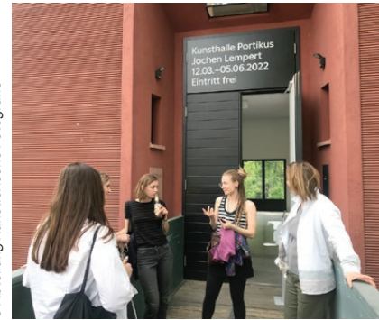
Exkursion Frankfurt/Bonn/ Köln/Düsseldorf/Eszen, 2022 Ausstellung Jochen Lempert, Portikus Frankfurt