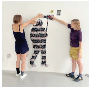
Ausstellungsaufbau Rundgang, 2022 Arbeit von Katharina Eckschläger