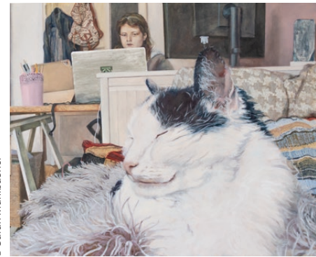
Conversation, 2021 Sarah Mühlbacher