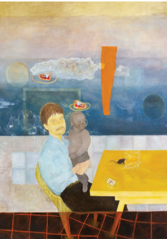
Ohne Titel, 2022 Sabrina Wildbacher

Exploration of traditional media and the themes of painting and graphics. Dialogue with other imaging techniques and current themes of art, forms of presentation and work analysis.