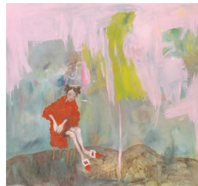
landscape for missing flowers, 2021 Magdalena Maller © Malerei & Grafik