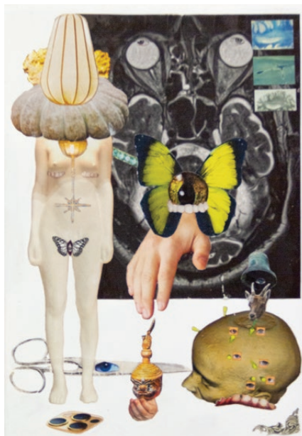
reflecting on duality, 2021 Fogosidad © Malerei & Grafik

With your entry to the programme, a research journey begins. It leads you to studios, workshops and workrooms, hallways, the café. We will meet each other in all these places. We have common research objects: the painted picture, the drawn work, the printed sheet, embroidered fabric, a fragmented photograph, the stage performance, the still life and the interior, portraits of people and animals, the body, micro and macro worlds, landscapes and abstraction.