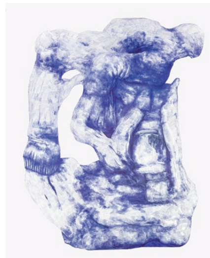
Ohne Titel, 2021 Michaela Kessler © Michaela Kessler