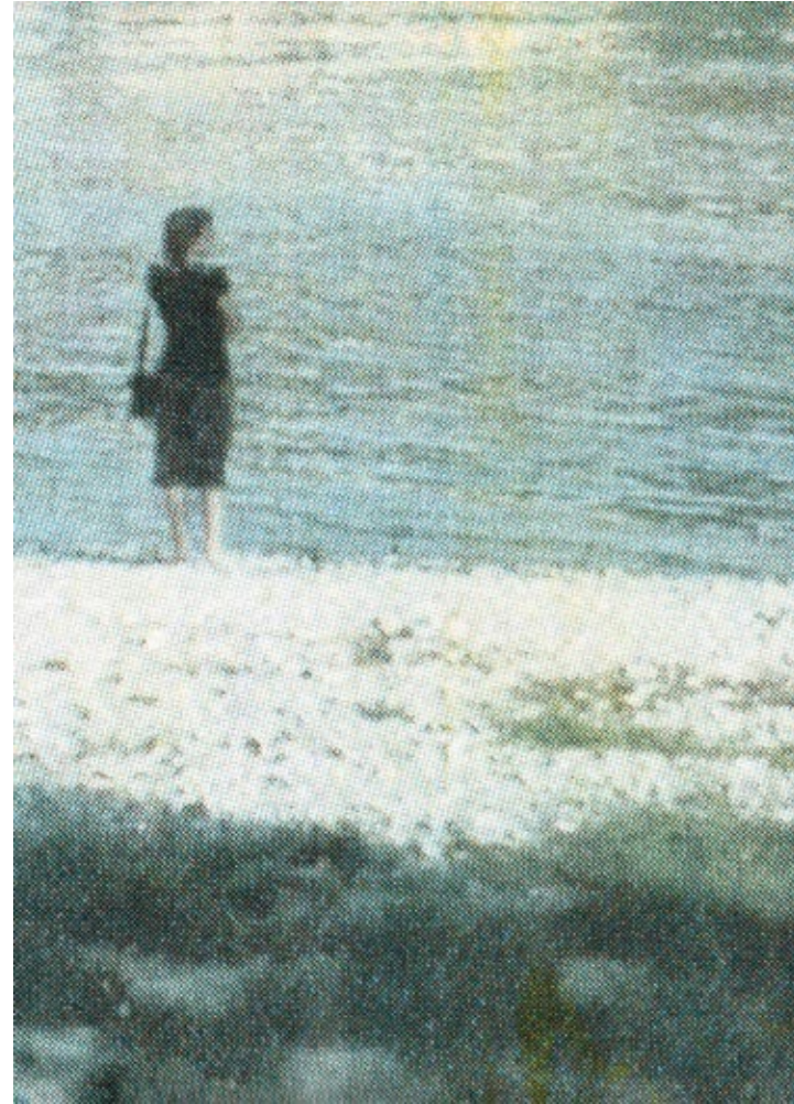
Monika Pichler Stehende Frau-c 4-Farben Siebdruck auf Seide 19x25 cm 2005