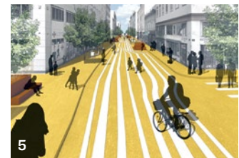
© Projekt „Lebensraum Hauptstraße“, Linz-Urfahr; Idee/Visualisierung: Architekturbuero 1

5 Erkundung Urfahr 9. Juni, ab 18 Uhr, Treffpunkt afo Linz-Urfahr ist ein Stadtteil im Wandel. Ein Stadtspariergang führt zu den wichtigsten Projektschauplätzen der kommenden Jahre: Was ist jetzt? Was wird in den nächsten Jahren sein? Besucht werden zudem das Kunstprojekt „Hinsenkamp LABOR“ und die Rauminterventionen „um uns“ von Studierenden der Kunstuniversität Linz.