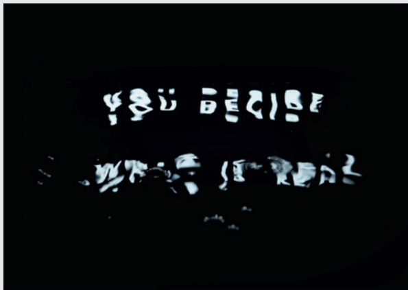
Susanna Katter, Type Daily: Display