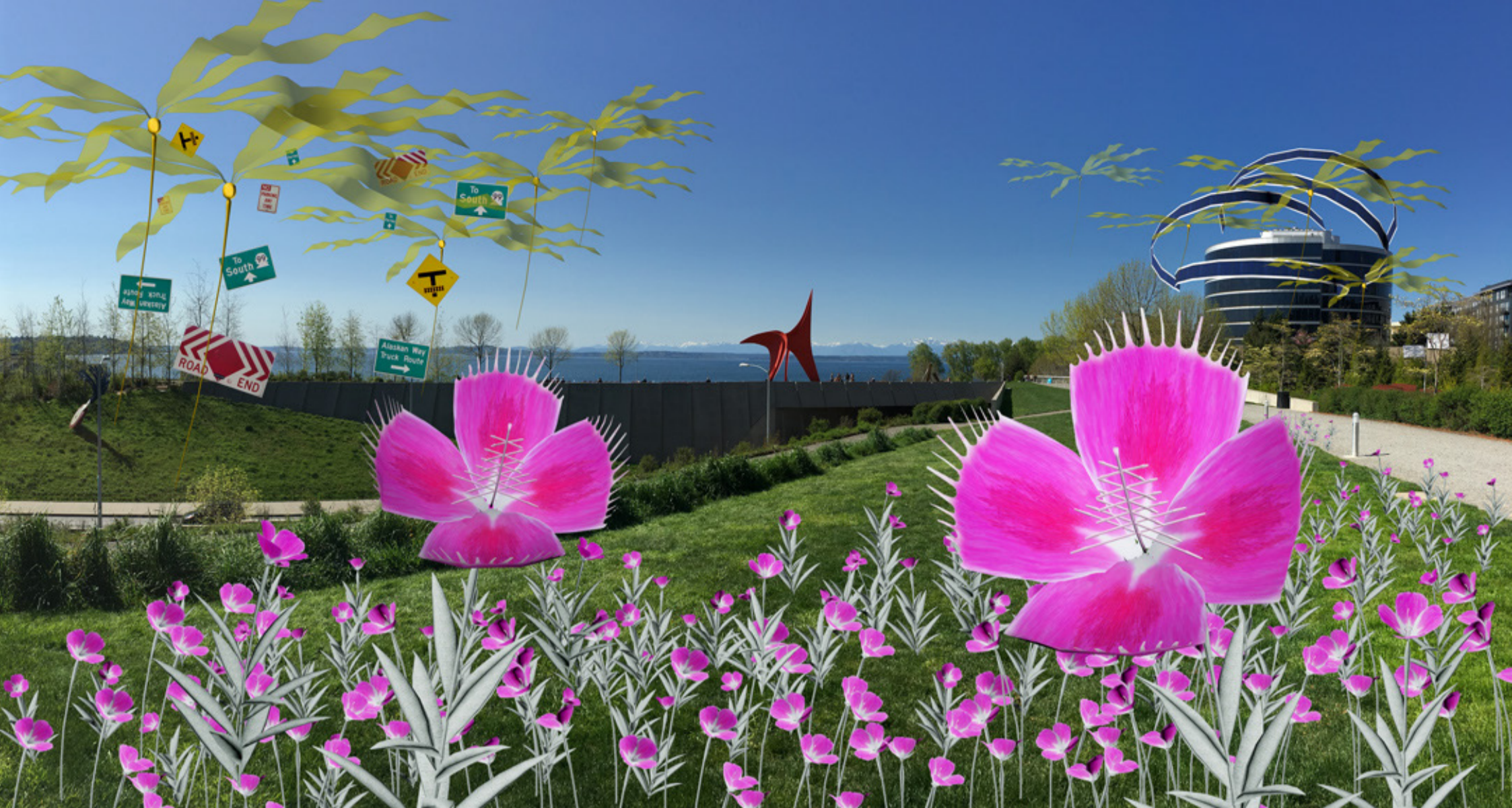
《人類世花園》，奧林匹克雕塑公園，西雅圖藝術博物館，多美子，2016 Gardens of the Anthropocene, Seattle Art Museum Olympic Sculpture Park, Tamiko Thiel, 2016