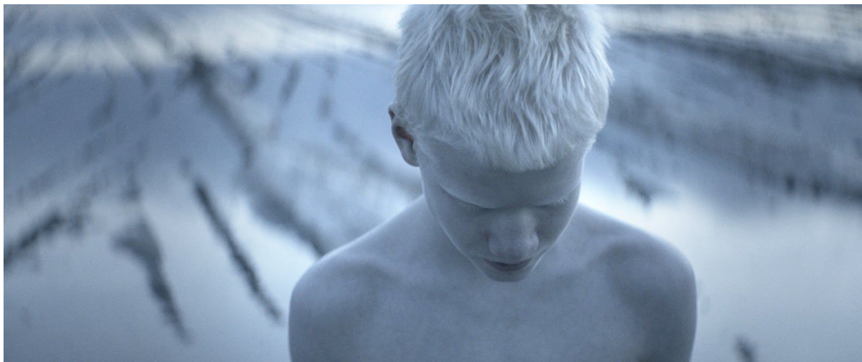
Limbo (FRANCE, GREECE 2016, COLOR, 29' 40 ) © Konstantina Kotzamani : Oscar nominated Short Film (2017)