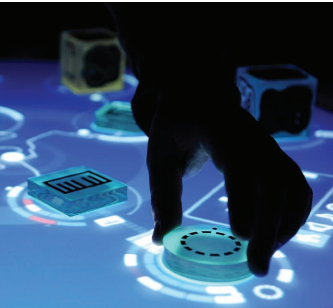
Reactable, 2007 © Jordá, Kaltenbrunner, Geiger, Alonso