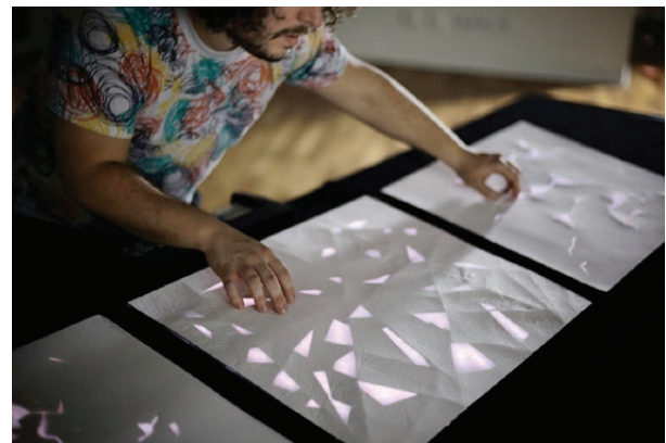
Tangible Scores, 2017 © Enrique Tomás