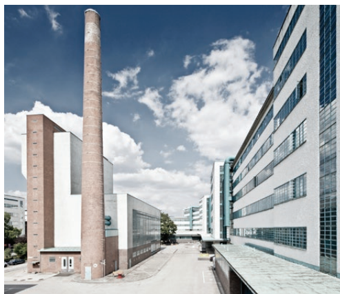
Tabakfabrik Linz